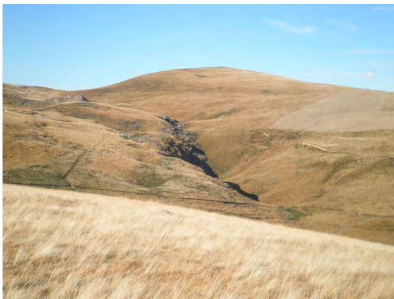
Cima de Coto la Horna

Último día para apuntarse: el viernes, 27 de enero de 2017